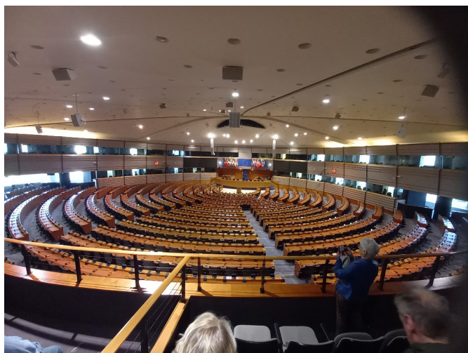
Hémicycle du Parlement européen

PS : Merci aussi à Nicole Vaucheret qui avec beaucoup de gentillesse nous a guidé pour le retour à la gare ; le petit groupe a eu un petit temps ensemble dans un café avant de reprendre le train !