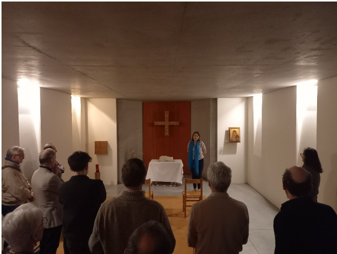
Crypte de la chapelle de l'Europe

Alors – malgré les 2 dernières conférences préparatoires, la dernière que j'ai même réécoutée, et diverses documentations, je restais sur une impression très abstraite ! Il fallait vraiment ce voyage - j'en profite pour remercier ce groupe de trois qui ont beaucoup travaillé pour tout organiser !!! - qui me semble être la seule chance de se rendre compte de cette architecture si complexe pour être efficace de façon démocratique de ces institutions. C'est une expérience !