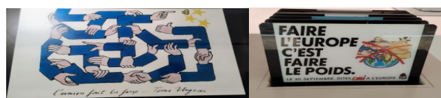
au musée de l'histoire européenne

La politique est vraiment entrée au Parlement européen. En un sens, c'est réjouissant car cela signifie que les citoyens ont bien compris l'importance de cette assemblée. Mais l'apparition, si tôt, d'une majorité capable de défaire l'Europe, est inquiétante.