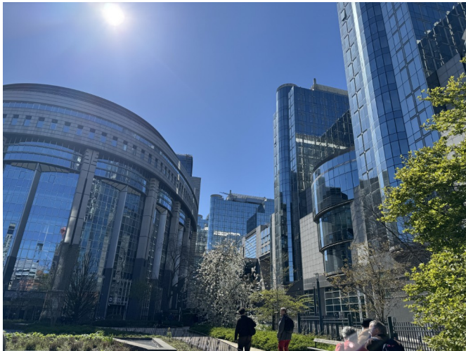
Immeubles du Parlement européen