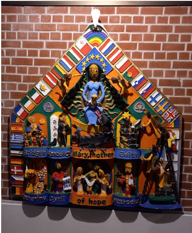
Marie et les saints de l'Europe, Chapelle de l'Europe

Après un voyage depuis Paris en TGV d'une heure et demi qui permet d'admirer un paysage plat et vert tout au long, avec des champs et des petites maisons, nous arrivons à Bruxelles. Nous repensons au plat pays de Jacques Brel « le plat pays qui est le mien » et au passage de la chanson « quand Bruxelles bruxellait ... ». On se prend à chanter et à rêver... puis le métro et la visite d'une chapelle ... pour l'Europe!