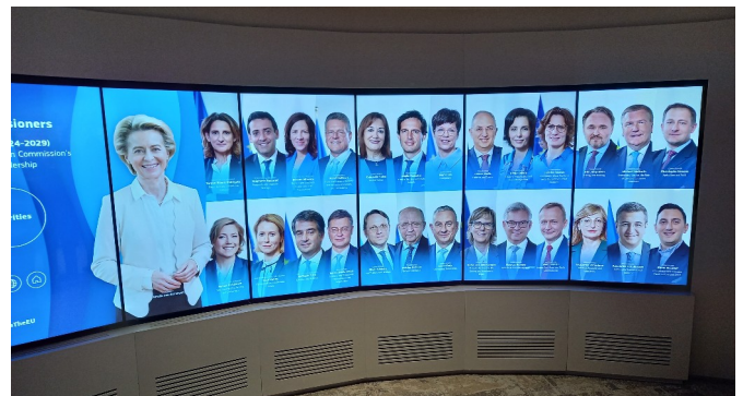
Les commissaires européens

Je mesure mieux à présent la mécanique institutionnelle nécessaire à faire fonctionner une démocratie de la taille d'un continent. Je comprends mieux aussi le sentiment d'éloignement du citoyen européen par rapport à une machinerie qui lui échappe. Il faut être très initié pour comprendre les enjeux à l'œuvre et les rouages d'une administration puissante à la capacité de réglementation foisonnante.