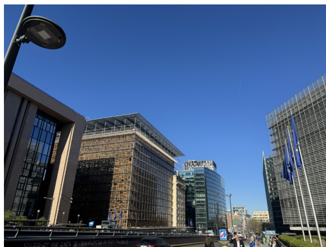
Conseil européen et Conseil de l'UE

Un voyage formidable, dense, et très bien organisé. Merci !