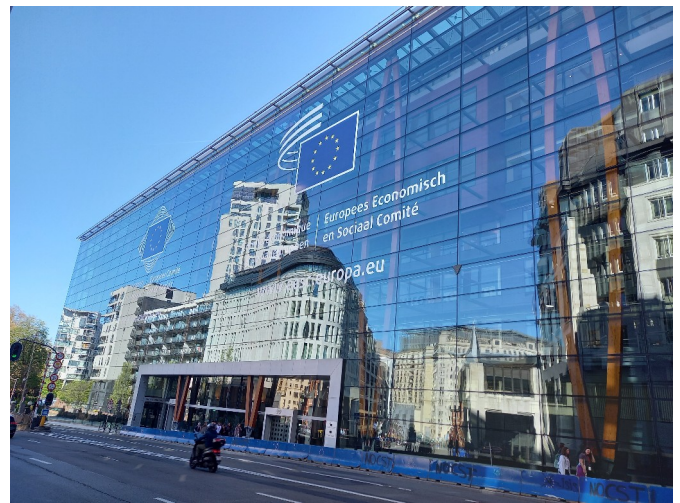
Bâtiment du CESEE

Nos régions peuvent recevoir des subventions de l'UE. La représentation ne compte que 5 permanents, ce qui est peu par rapport à d'autres pays, les Landers allemand par exemple.